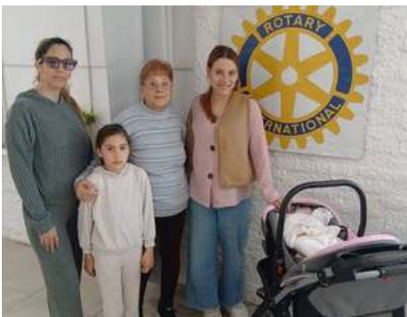
Rotary Club – Costa del Inmigrante: Entrega de cochecito

Enmarcado en la celebración del Día del Niño, nuestra institución brinda un agradecimiento muy especial a la empresa » Sonrisas del Sur» , Laflia SAS por la donación de calzado para escolares recibida en el día de hoy. Los mismos serán distribuidos en escuelas de la zona el 29 de agosto. ¡Muchas gracias!