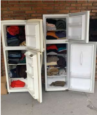
Rotary Club – Costa del Inmigrante: Campaña del abrigo en heladeras solidarias

Siguen llegando donaciones para la campaña del abrigo, las mismas están a disposición de quienes las necesiten en nuestras heladeras solidarias, ubicadas en la casa rotaria.