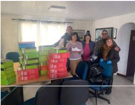
Rotary Club – Costa del Inmigrante: Donación de calzado para escolares

¡Gracias a todas las personas que hacen esto posible!