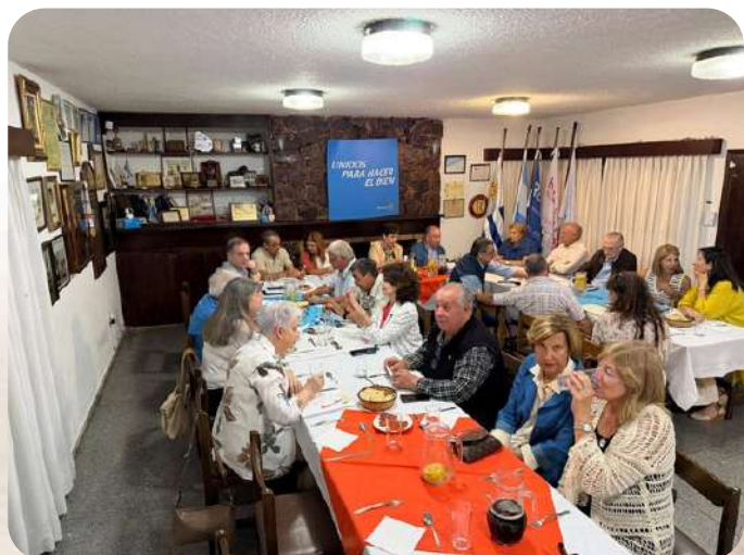
RC Maldonado Este 12/01/26