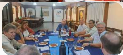
RC Pan de Azúcar 13/01/26