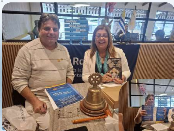
RC Isla Gorriti Punta del Este 11/01/26