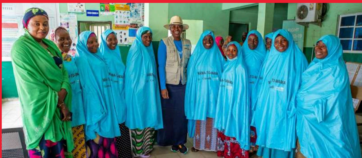
Mujeres voluntarias de la iniciativa Mama2Mama en Nigeria.