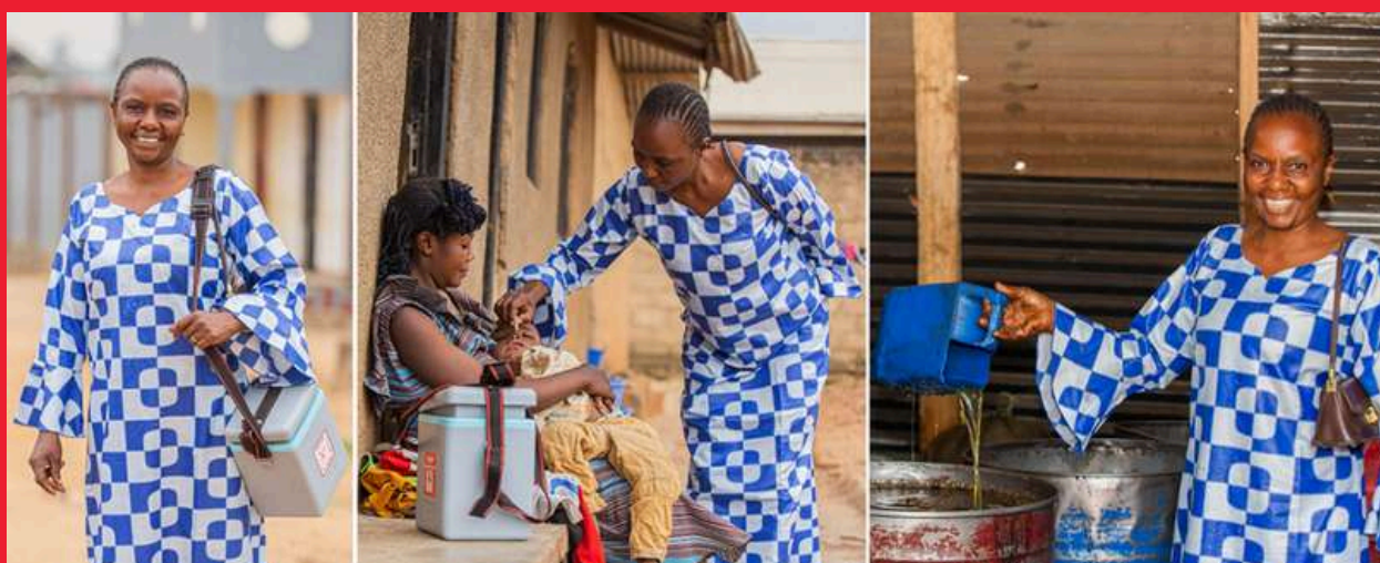
Iniciativa Washindi en República Democrática del Congo